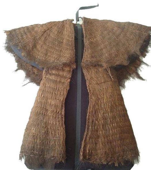
Manteau de pluie Extrême-Orient, XIX ème siècle Musée Bargoin, Ville de Clermont-Ferrand