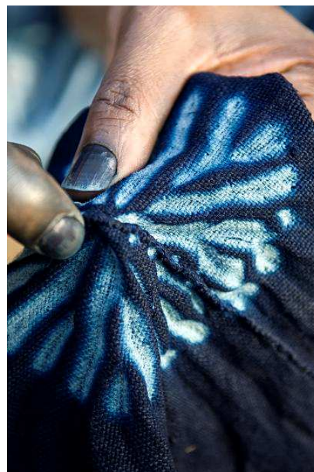
Travail de l'indigo d'Abouakar Fofana