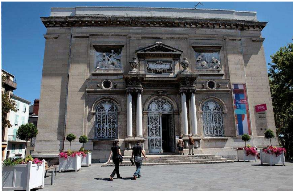
Musée Bargoin, Clermont-Ferrand

Les expositions temporaires sont l'occasion de développer et d'approfondir certains thèmes textiles. Ces rendez-vous offrent également au public la possibilité de découvrir de nouvelles formes, de nouvelles techniques et d'aller à la rencontre d'artistes textiles contemporains.