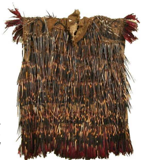
Tunique porc-épic Cameroun Collection Louis Dubreuil