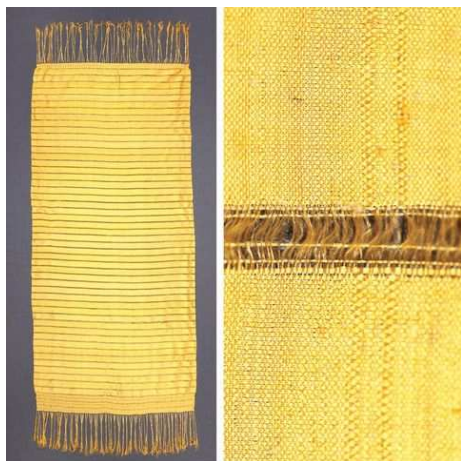
Châle en soie d'araignée Madagascar, XXI ème siècle © Simon Peers

>>> Le choix du matériau est important. Il est effectué en fonction du milieu mais est aussi lié à un système de valeurs où s'entremêlent enjeux symboliques, implications sociales, raisons historiques et intérêts économiques.