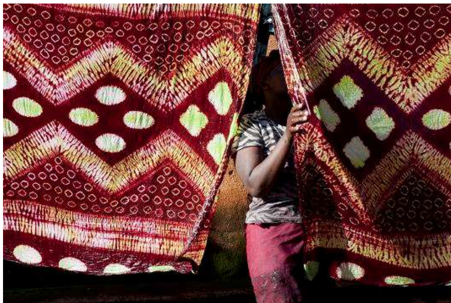
Teinturière à Bamako

changer notre regard, se décentrer, changer notre perception des hommes et du monde