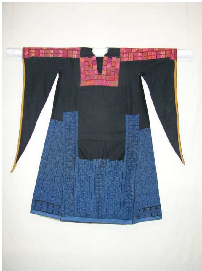
Robe de femme palestinienne toile de coton brodée au point de croix désert du Neguev, XXe siècle

>>> Face à la mondialisation, à l'uniformisation des moyens de productions et aux contraintes économiques concernant les coûts de la main d'œuvre et des matières premières de nombreuses traditions textiles s'étiolent. Pourtant, certains savoir-faire perdurent et constituent une marque de résistance visible en affirmant haut et fort une identité.